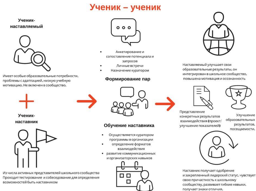
Рисунок 1. Графическое представление взаимодействия по форме «ученик – ученик»